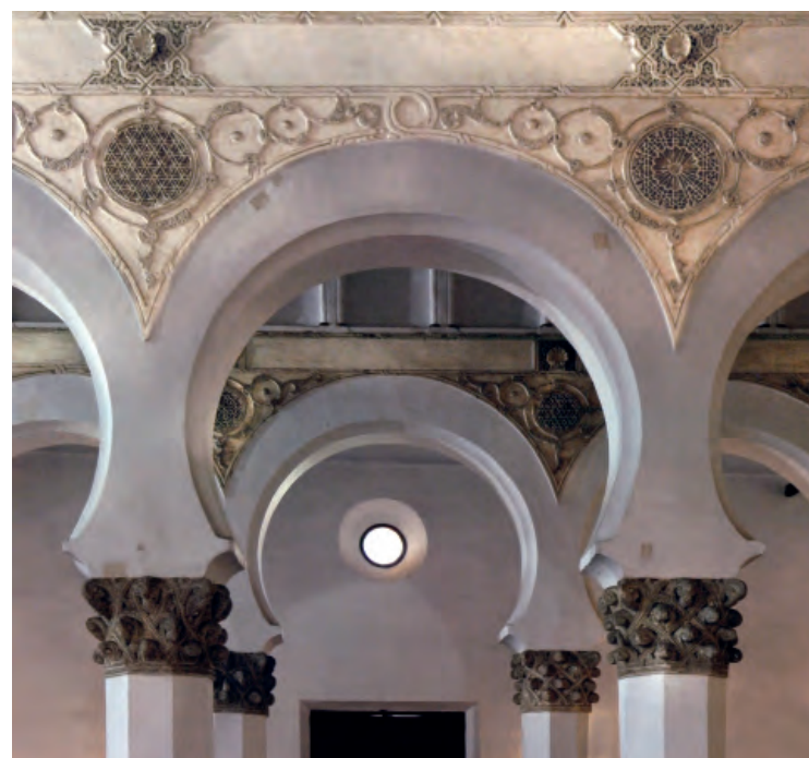
Sinagoga de Santa María la Blanca

J.E. Ruiz-Domènec y J. Bérchez Por la historia de España Fundación Bancaja, Valencia, 2010 191 páginas; 30 euros